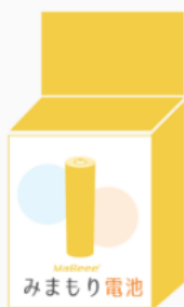
みまもり電池 (パッケージ箱)